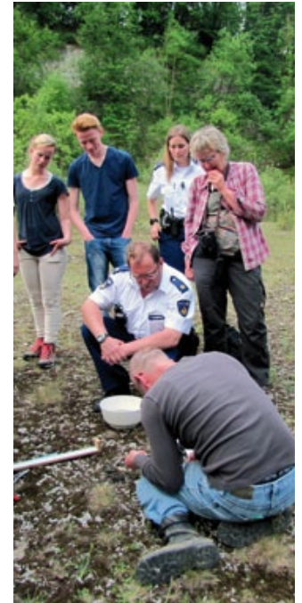
Belangstelling voor het onderzoek.