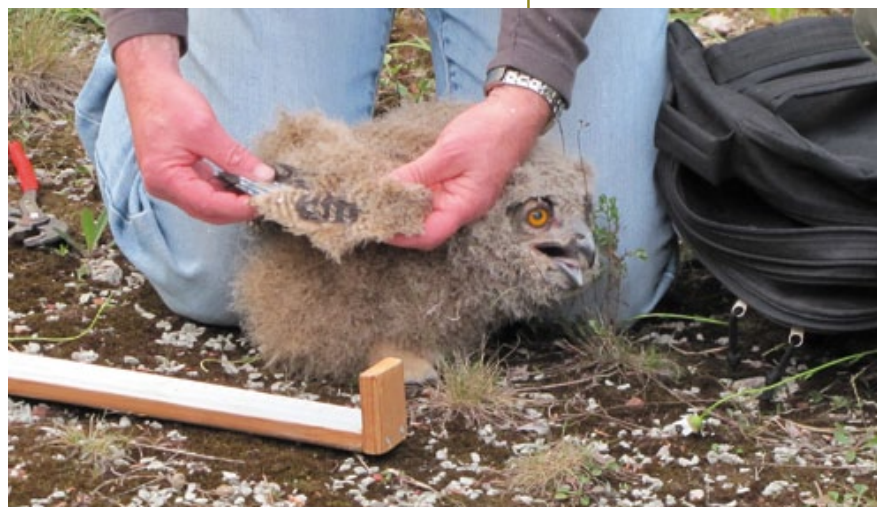
De vleugellengte wordt opgemeten.